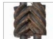
炭素鋼 + コーティング