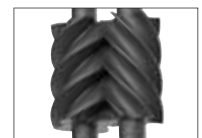
ステンレス + コーティング